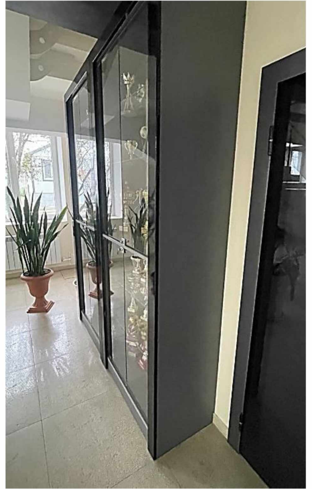
Общий вид 2 шкафов-витрин, установленных рядом.